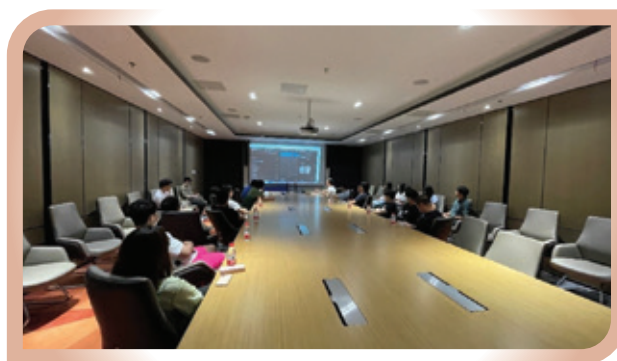
有關AI美術設計的培訓