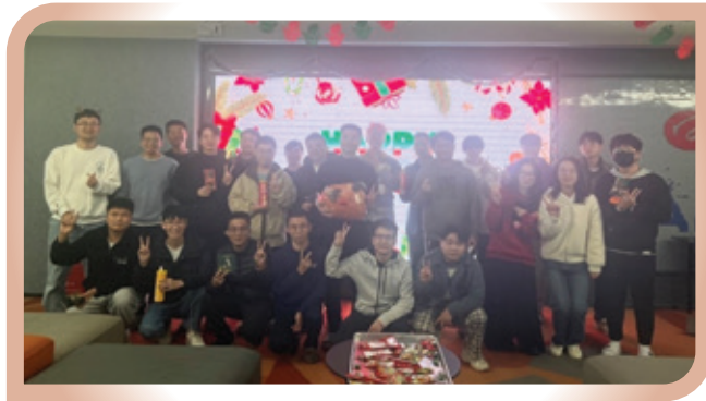
深圳地區的聖誕員工聚會