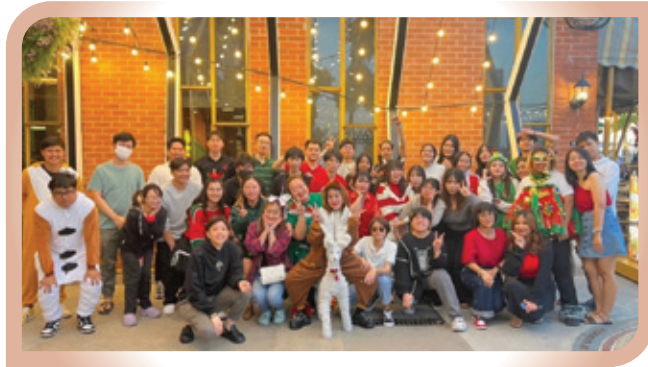
泰國地區的聖誕員工聚會

為了表達對員工的關愛和重視，我們在法定節假日採取多種方式來犒勞員工，包括節日聚餐、抽獎活動和禮品，作為感謝和鼓勵，這不僅讓員工感受到自己的努力和貢獻被認可，同時也增強了員工對本集團的歸屬感。此外，我們定期為員工舉辦生日會，並準備生日蛋糕和生日禮物。我們亦通過舉辦各不同的遊戲和體育活動增進員工之間的交流，加強同事之間的聯繫和合作，增加團隊凝聚力。