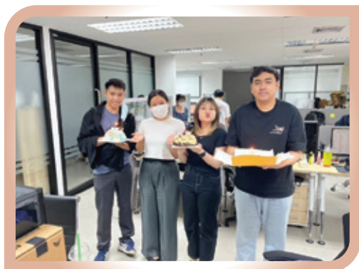
每月為員工舉辦的生日會