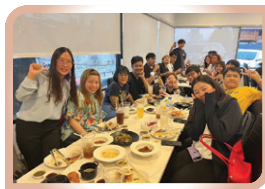
定期舉行員工聚餐